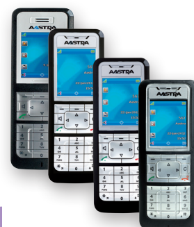
Терминалы серии 600c/d