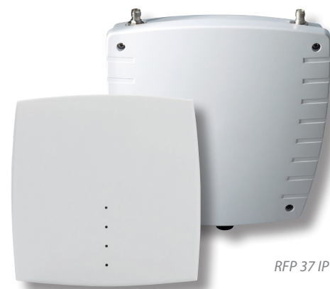
RFP 37 IP